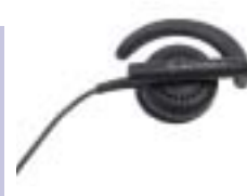
BDN6720 – Elastyczny odbiornik douszny

64-Kanałowy radiotelefon, z 8-znakowym, podświetlanym wyświetlaczem oraz 10 ikonami, przeznaczony dla kierownictwa i pracowników większej firmy. Pełna, odpowiednio skonfigurowana klawiatura umożliwia natychmiastowe połączenia indywidualne lub wywołanie grupowe, zapewniając jednocześnie dostęp do menu i listy kontaktów, spełniającej funkcję książki telefonicznej. Użytkownik – dzięki funkcji wyświetlenia – ma możliwość natychmiastowej identyfikacji wywołującego. Blokada klawiatury