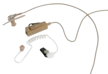
HMN9754 – 2-przewodowy zestaw mikrofono-słuchawkowy z przyciskiem PTT (kolor beżowy), NTN8371 – Fonowód