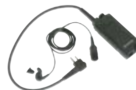
BDN6646 – Indukcyjny zestaw słuchawkowy z przyciskiem PTT