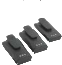
Akumulatory Li Ion, NiCd i NiMH