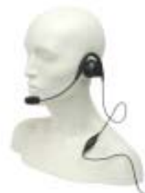
MDPMLN4444 – MAG ONE Zestaw słuchawkowy z przyciskiem PTT/VOX na kablu