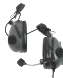
RMN4053 – Zestaw podhełmowy z pasywnymi ochronnikami słuchu (kolor szary)