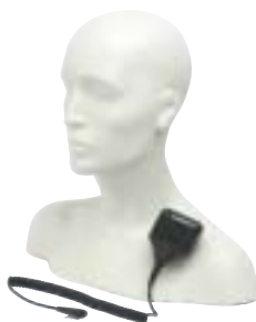
HMN9030 – Mikrofonogłośnik