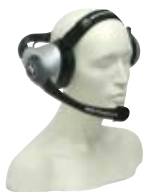
RMN5015 – Ciężki zestaw nagłowny (wymaga użycia kabla z adaptorem RKN4090)